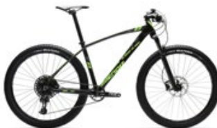
Negro y pistacho