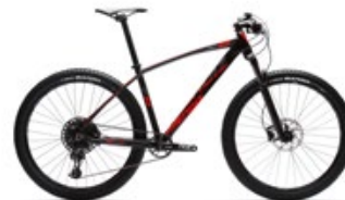
Negro y rojo