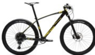
Negro y amarillo