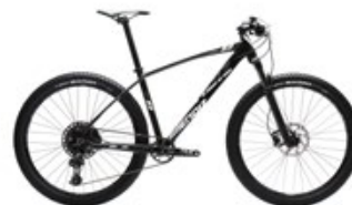
Negro y blanco